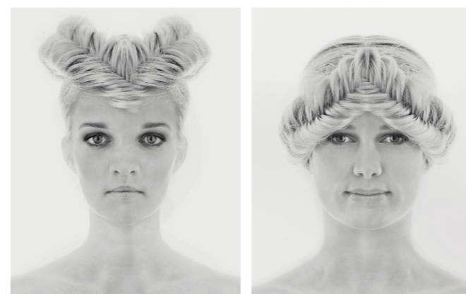
SOMEBODY OR NOBODY. Jesper har fotograferat uppemot 200 personer med samma teknik.

PER KÄGSTRÖM pk@hallandsposten.se 010-471 51 33