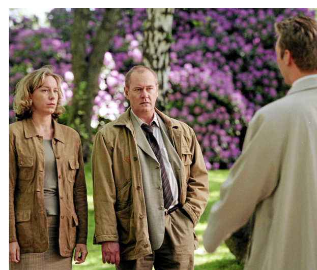
MER BECK. Bild från inspelningen av den nionde Beck-filmen från år 2000.

Förutom Persbrandt och Haber dyker ännu fler bekanta ansikten upp igen – enligt Aftonbladet är det också klart att Måns Natha-